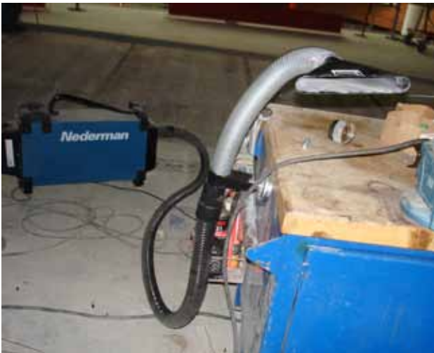
Placering av mobilt punktutsug som används vid svetsning på arbetsbänk. Magneten har fästs på bänkens sida.