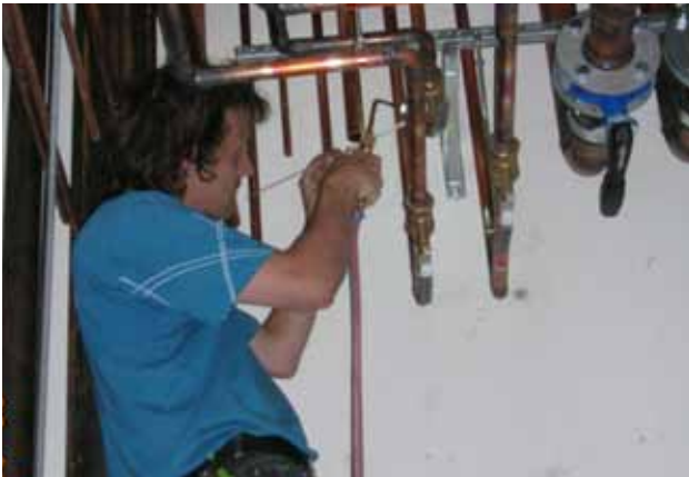
Lödning av kopparrör från hantverkarställning.

Går det att pressfoga eller klämfoga rör istället för att löda? Man kan pressfoga rör av koppar, förzinkat och rostfritt stål. Särskilt bra är att pressfoga rör i stället för att löda i utrymmen med obefintlig eller dålig ventilation.