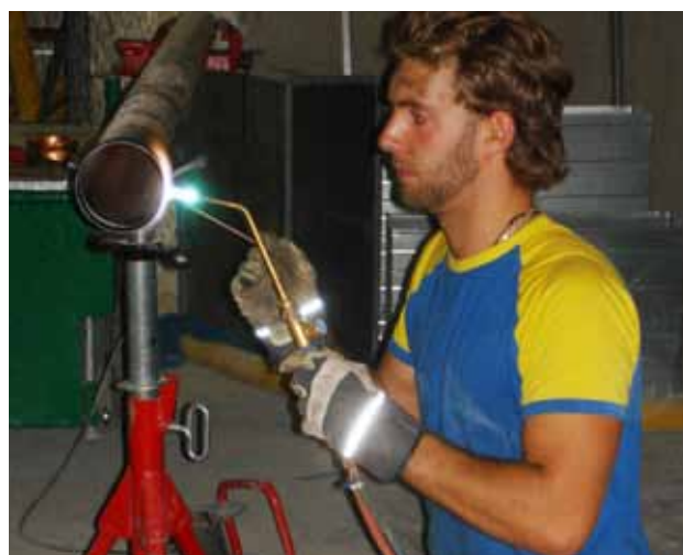
Vid lödning av kopparrör bildas kolmonoxid.