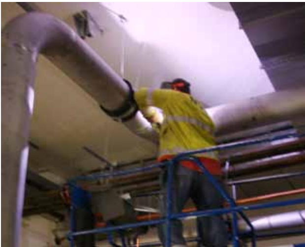
Svetsning från saxlift.