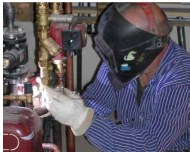
Vid TIG-svetsning bildas vanligen lite svetsrök.