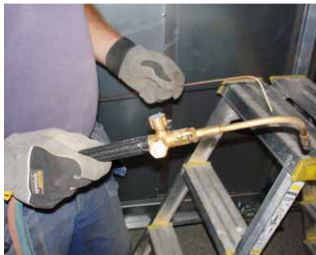
Utrustning för lödning av kopparrör.

Mer att läsa finns i rapporten "Kemiska hälsorisker vid svetsning och lödning på tillfälliga arbetsplatser. En studie av VVS-montörer", www.vvsforetagen.se samt www.byggnads.se och i rapporten "Vilka luftföroreningar förekommer vid gaslödning av rör och i hur höga halter?" som finns på www.ivl.se under publikationer.