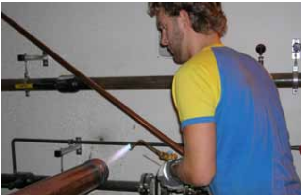
Lödning vid arbetsbänk.