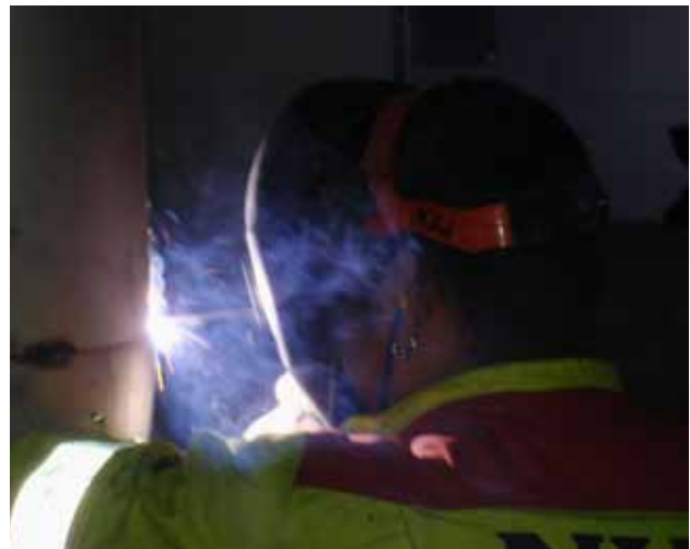
Pinnsvetsning. Det uppstår kraftig rökutveckling vid svetsning med belagda elektroder.