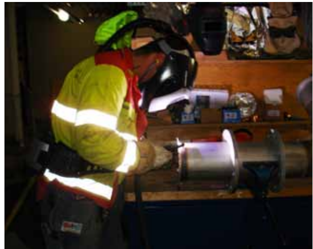
Svetsning på arbetsbänk sker i en framåtlutad position. Svetsplymen stiger rakt upp mot svetsarens ansikte. Andningskyddet skyddar svetsaren från att andas in svetsröken.