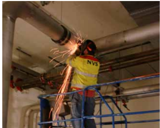
Slipning i samband med pinnsvetsning.